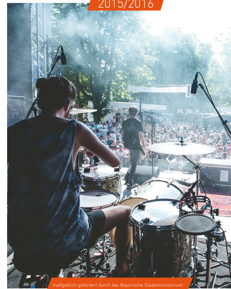
maßgeblich gefördert durch das Bayerische Staatsministerium für Wirtschaft und Medien, Energie und Technologie

„Die wichtigste Grundlage für eine erfolgreiche Laufbahn im Musikbusiness ist und bleibt ein ordentliches Gaffatape.“